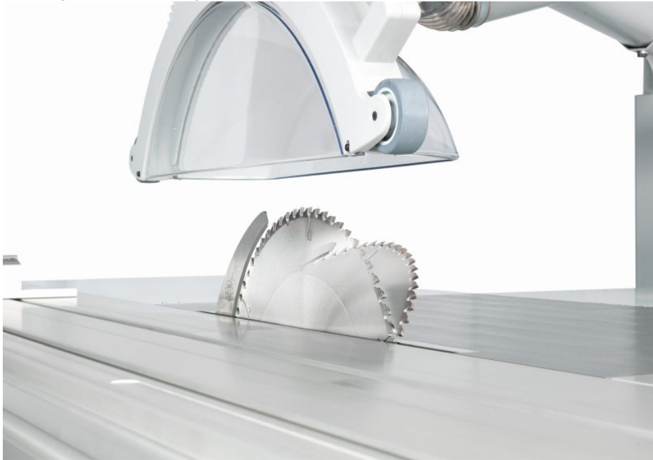
Kreissägeblattschwenkung 0 bis 45 Grad.

155 Millimetern bei 90 Grad und 109 Millimetern bei 45 Grad sind mit der neuen Formatkreissäge Besäum- und Trennschnitte in Massivholz wie Eiche oder Abläng- und Gehrungsschnitte großdimensionierter Querschnitte problemlos realisierbar. Die Kreissägeblattschwenkung ist zwischen 0 bis 45 Grad ausführbar.