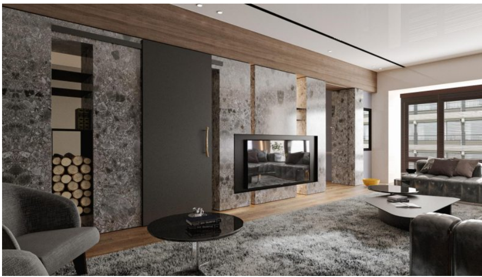
Designlinie »Evolution IV« (Bild: optimiert (Bild: Hermann Francksen Nachf.).