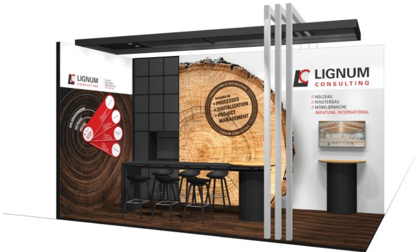
Messestand in Halle 9 (Bild: Lignum Consulting).

Auf der Holz-Handwerk 2026 informiert Lignum Consulting in Halle 9, Stand 323, über das umfangreiche Beratungsprogramm.