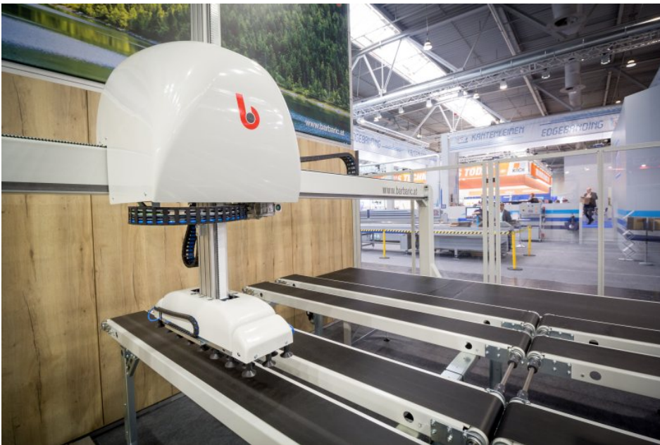
Returnsystemen für den Ein-Mann-Betrieb an der Kantenanleimmaschine.

Die neuen »CSF Multilevel«-Lagersysteme bieten größtmögliche Flexibilität für Kunden mit hohen Hallen. Mit dieser Lösung bietet Barbaric die Möglichkeit, im oberen Stock Platten zu lagern und die Bearbeitungsmaschine auf Bodenniveau zu beschicken. Für besonders hohe Leistung und Lagerkapazität können aber auch mehrere Lagersysteme übereinander realisiert werden.