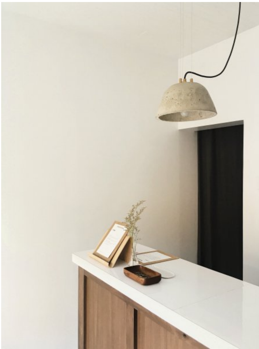
Der Designtrend »Warm Craft« bietet Wahrnehmen mit allen Sinnen.

Urban Agility: Neue agile Dekore für Arbeits- und Lebensräume. Noch nie waren wir dynamischer, weshalb wir uns nach Strukturen sehnen, die sich unseren Bedürfnissen und Wünschen permanent anpassen. Das gilt insbesondere dann, wenn die räumliche Trennung zwischen Arbeiten und Entspannen zunehmend verschwimmt. Räume sollen sowohl die Kommunikation fördern als auch Rückzugsorte bieten. Um verschiedene Bereiche zu schaffen, kann man zum Beispiel mit unifarbenen Dekoren und Holzoptiken eine Unterscheidung herstellen, die trotzdem Harmonie ausstrahlt. Cosy Bohemian: Sinnlichkeit kombiniert mit Wohlbehagen für gemütliche Rückzugsorte. Kunsthandwerk trifft auf Interior-Trends – wenn orientalische Einflüsse und opulente Muster mit zeitloser, eleganter Eichenmaserung verschmelzen, dann entsteht ein Fest für alle Freunde ungewöhnlicher Mischungen. Diese besonders spannende Kombination hat Swiss Krono in einigen der Design-Dekore zusammengeführt.