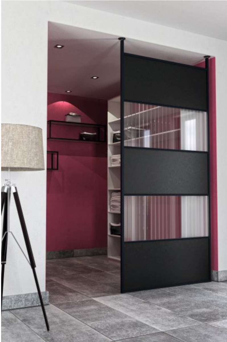
Beispiel für eine Nutzung als begehbare Kleiderschrank.

gleichzeitig als dekoratives Designobjekt. Konzipiert ist das System für 16 und 19 Millimeter starkes Dekor-Plattenmaterial. So kann die farbliche Durchgängigkeit der verschiedenen Lebensräume realisiert werden.