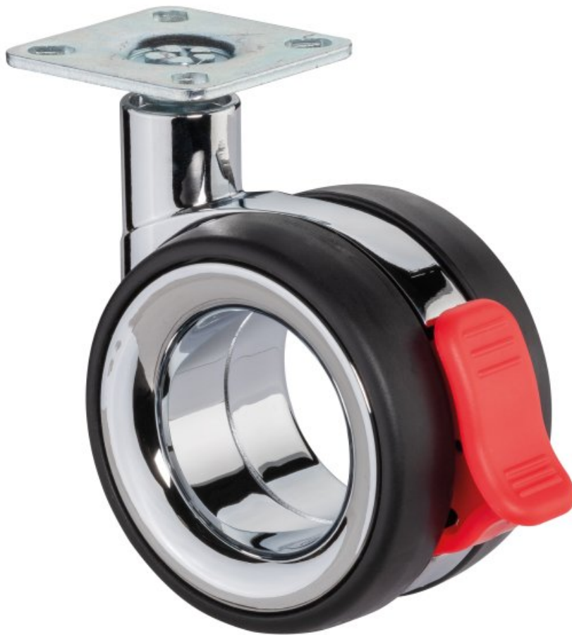
Design-Blickfang: Kugelkranztechnologie für Doppelrollen.

Multifunktionalität und Konfiguration für jeden Einsatz ist ein weiterer Trend. Dem folgend können die Kunden bei BS Rollen die Apparaterollen individuell zusammenstellen, denn die universellen Rollen kommen überall im Möbelbereich zum Einsatz. So findet man die Doppelrollen für den Indoor- und Outdooreinsatz nicht nur unter Strandkörben, Lounge- und Palettenmöbeln, sondern ebenso unter dem Grill oder dem Hochbeet, aber auch im Laden- bzw. Displaybau oder unter der Verkaufstheke. Die unterschiedlichen Rollen bieten hohe Belastbarkeit und gute Manövrierfähigkeit.