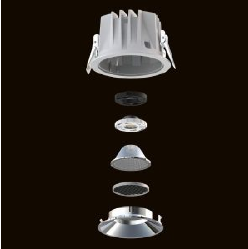
Einbaustrahler aus der Serie »Modullight« mit frei konfigurierbaren bzw. auswechselbaren Komponenten (Bild: DWD Concepts).

Diese Entwicklung beobachtete der Lichtspezialist DWD Concepts aus Dortmund und bietet als Lösung mit seinen Leuchten aus der Reihe »Modullight« jetzt ein zukunftsweisendes Konzept an.